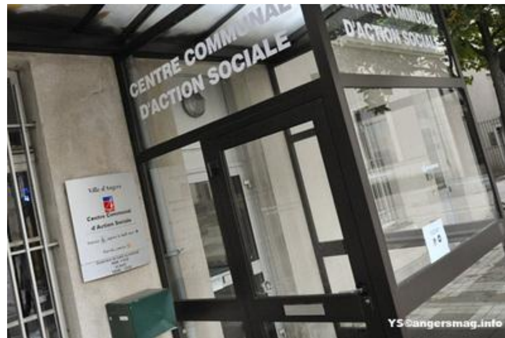
Le CCAS, un acteur de poids dans la mise en œuvre de la politique sociale de la Ville !

Associer tous les angevin-e-s à l'amélioration de la qualité de vie, une priorité pour notre groupe d'élu-e-s !